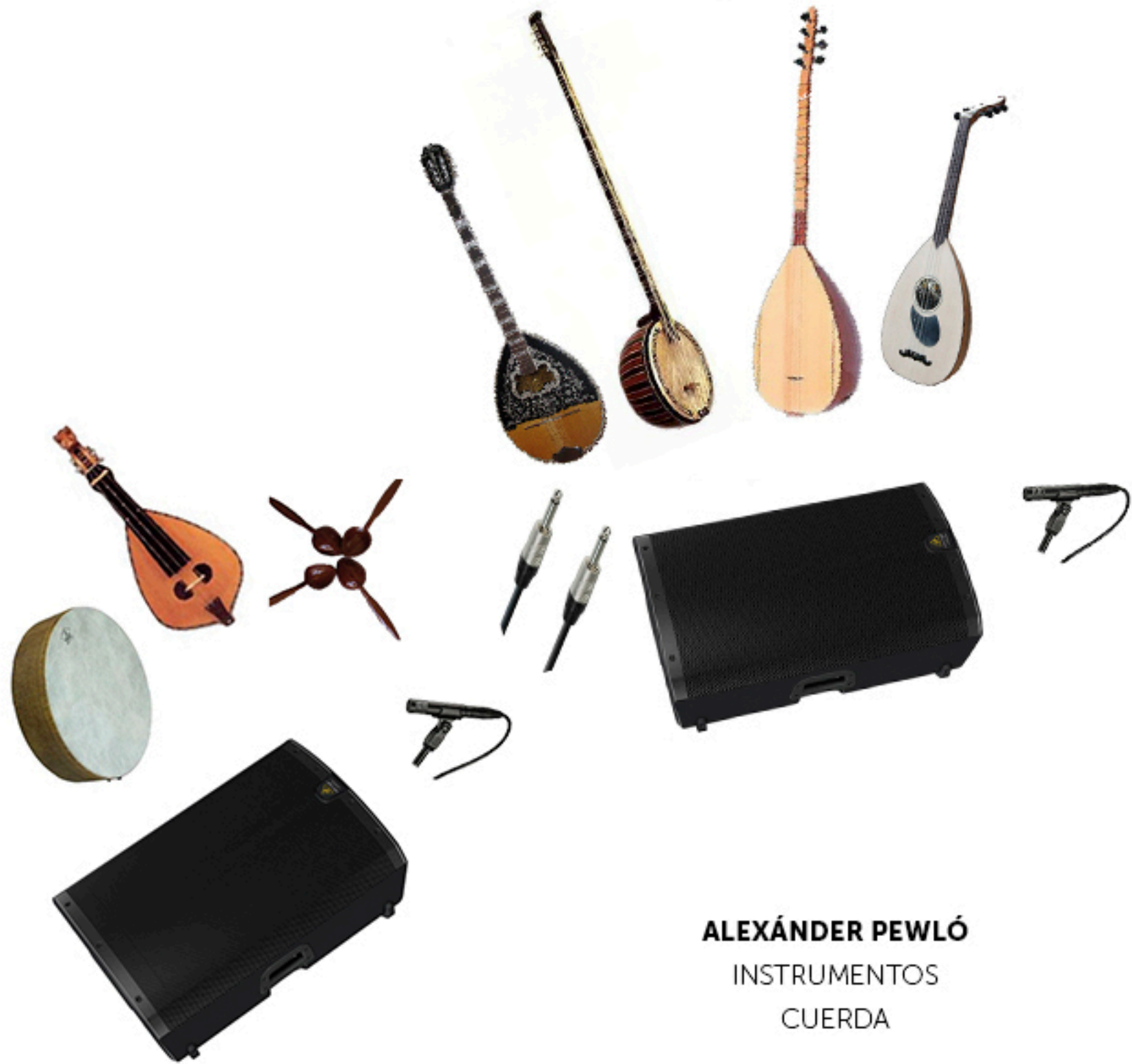
ALEXÁNDER PEWLÓ INSTRUMENTOS CUERDA