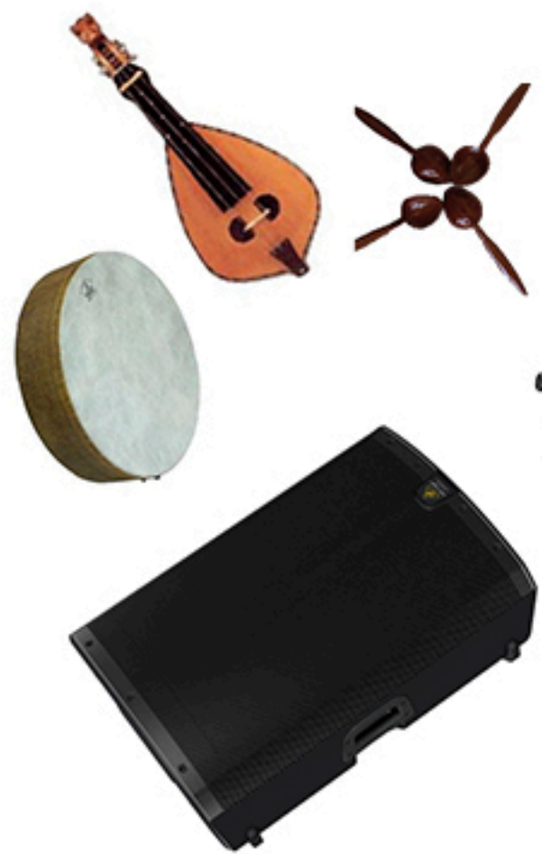
NATALIA MARTÍN INSTRUMENTOS PERCUSIÓN Y CUERDA