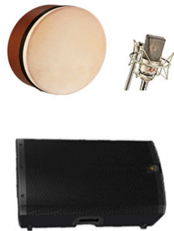
SARA ISLÁN VOZ Y PERCUSIÓN