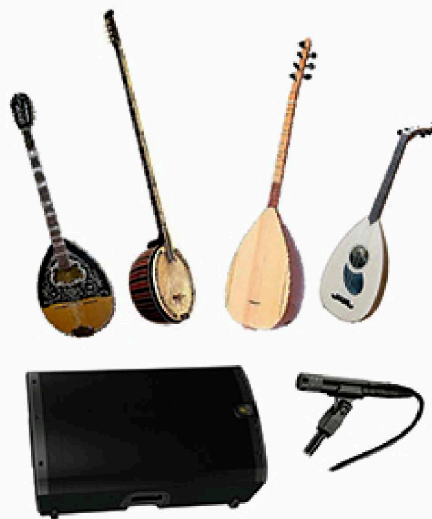
ALEXÁNDER PEWLÓ INSTRUMENTOS CUERDA