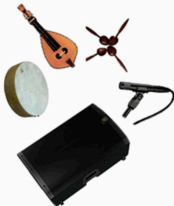
NATALIA MARTÍN INSTRUMENTOS PERSUSIÓN Y CUERDA